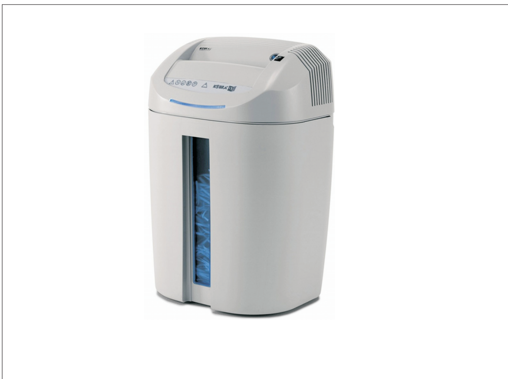
Skartovací stroj KOBRA +1 SS4/SS6/SS7 KOBRA +1 CC4